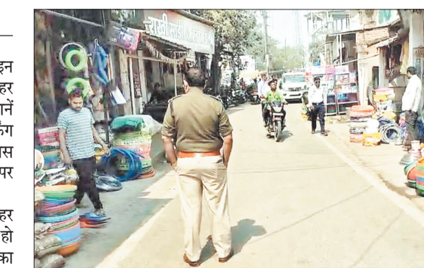
पार्किंग व्यवस्था दुरुस्त करने को लेकर सड़क पर उतरे यातायात प्रभारी।

सक्ती शहर की यातायात व्यवस्था इन दिनों पूरी तरह से बेलगाम हो गई है। शहर के व्यवस्था मार्गों पर सड़क पर दुकानों के सजने और जहां तहां बेतरतीब पार्किंग करने से अक्सर जाम लग जाता है। खास करके शाम के समय तो प्रमुख मार्गों पर जाम की समस्या आम हो गई है। जिला बनने के बाद भी सक्ती शहर की यातायात व्यवस्था दुरुस्त नहीं हो सकी है। कहने को तो जिले में ट्रेफिक का अमला मुस्तैद है, लेकिन गाड़ियों की बेतरतीब पार्किंग और दुकान के सामने सामान लगाने की प्रवृत्ति ने आम लोगों की परेशानी बढ़ा दी है। कार्यवाही नहीं होने से दुकानदार व वाहन चालकों के हौसले