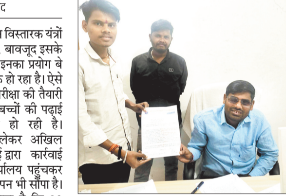
अधिकारी को ज्ञापन सौंपते अभावपि के पदाधिकारी।

प्रशासन द्वारा परीक्षा के मद्देनजर ध्वनि विस्तारक यंत्रों के प्रयोग पर प्रतिबंध लगाया गया है, बावजूद इसके शहर सहित आसपास के इलाके में डीजे प्रयोग वे रोक टोक हो रहा है। ऐसे में बोर्ड परीक्षा की तैयारी कर रहे बच्चों की पढ़ाई प्रभावित हो रही है। इसको लेकर अखिल भारतीय विद्यार्थी परिषद, राहौद इकाई द्वारा कार्रवाई की मांग की गई है। तहसील कार्यालय पहुंचकर विद्यार्थी परिषद ने तहसीलदार को ज्ञापन भी सौंपा है। सौंपे गए ज्ञापन में उन्होंने बताया है कि 20 फरवरी से बोर्ड की परीक्षा शुरू हो गई है। इसको लेकर 19 फरवरी को ही जिला प्रशासन द्वारा ध्वनि विस्तारक यंत्रों के प्रयोग पर प्रतिबंध लगाने संबंधी आदेश भी जारी किया गया है। बावजूद इसके राहौद शहर सहित आसपास के गांवों में इस आदेश का पालन नहीं हो रहा है। जगह-जगह मनमाने तरीके से कानूफोड संगीत, डीजे आदि का प्रयोग हो रहा है, जिससे बोर्ड परीक्षा दिलाने वाले बच्चों की पढ़ाई