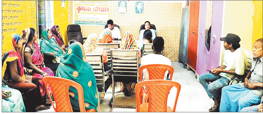
कृषक चौपाल में किसानों को जानकारी देते अधिकारी।

जिले के समस्त विकासखण्डों की ग्राम पंचायतों में 13 फरवरी से 3 मार्च तक कृषि पखवाड़ा अंतर्गत कृषक चौपालों का व्यापक आयोजन किया जा रहा है। इसी क्रम में ग्राम पंचायत भद्रीपाली, बासीनपाटा, मानिकपुर, पलाडीखुर्द, लहंगा, मोहगांव, जर्व, पोरथा, भेडापाली, जुनवानी, परसदाखुर्द, जोगरा, अमलडीह, सोंठी, सुकलीपाली, बुंदेली, गोरखापाली, चिमाणी, पोता, कनईडीह, कलमी, चरौदा, अडुभार, सारसकेला, बरभाटा, अचरितपाली, घोघरी, कुरुदी, बालपुर, लटेसरा, मडवा, छोटे कटेकोनी, सिंधितराई, चुरतेली, जवाली, कुरुदी, बालपुर, लटेसरा, मडवा, बगरल, चूराथाटा, तेनुमुडी, मांजरकुद, दर्रा, साल्हे, अकोलजमोरा, बलकरी, कलमीडीह, आमपाली,