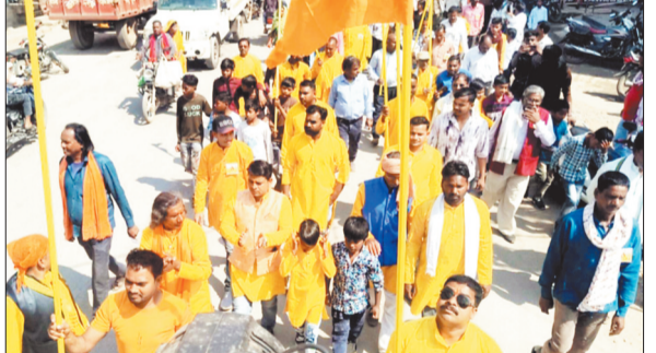
शोभा यात्रा निकालते समाज के लोग।