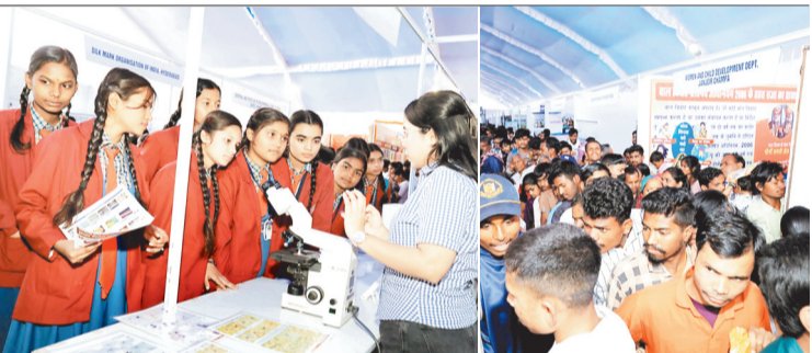
प्रदर्शनी का अवलोकन कर जानकारी प्राप्त करती छात्राएं।